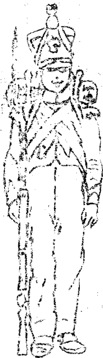
fusilier fusilier (keizerlijke garde)