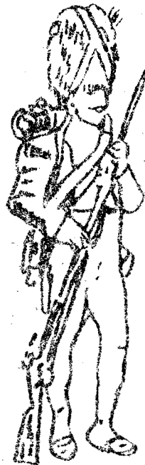
chasseur à pied jager (behorend tot voetvolk)