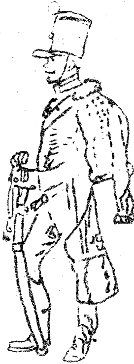
chasseur à cheval jager te paard